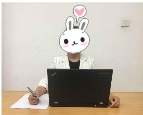
图一：面试主机位图

考生以“双机位”硬件设备进行复试，需两部带摄像、话筒、外放功能的设备，电脑、手机均可。第一机位为面试主机位，面向考生，用于复试教师对考生的远程视频考核（最好为笔记本电脑）。第二机位为面试副机位（监考机位），放于考生侧后方45度，用于复试教师和视频监考员在面试过程中观测考生的后方及周边环境情况。放置面试主机位的书桌应紧贴墙面摆放。