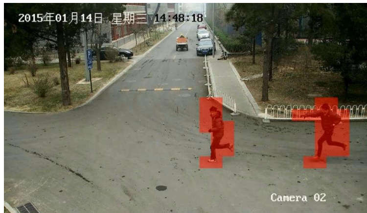
异常事件（追赶）视频示例