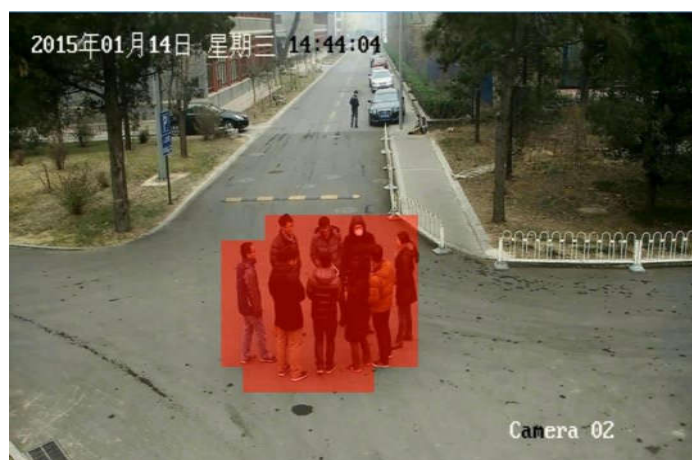
异常事件（群体聚集）视频示例