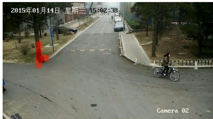
异常事件（丢弃箱包）视频示例