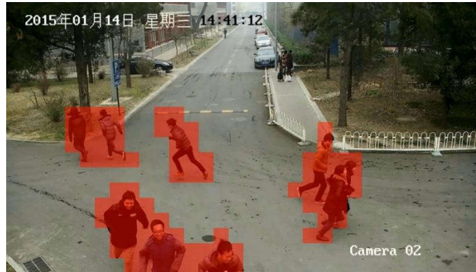
异常事件（群体逃散）视频示例