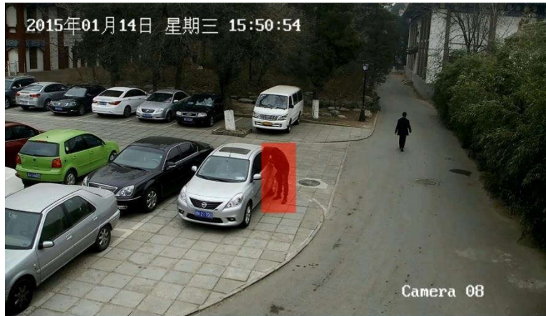
异常事件（敏感区域徘徊）视频示例